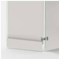
Avec socle à traîner sur la porte