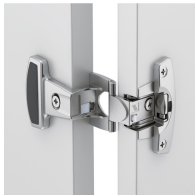
Paumelles métalliques à boîtier avec angle d'ouverture de 240