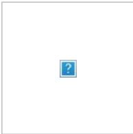
Stauraum für bis zu drei Materialwägen