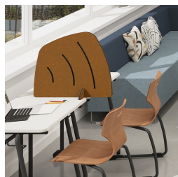
Als Sichtschutz auf Schultischen

Vous trouverez notre gamme de matériaux et de couleurs dans l'aperçu des matériaux ASS.