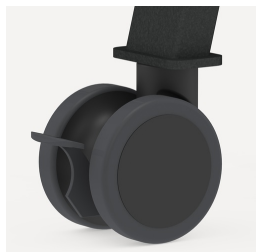
Vier große Doppelaufrollen jeweils mit Feststellbremse