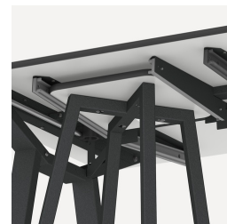
Halterung für FLEXLAB Hocker und Tidy Boxen