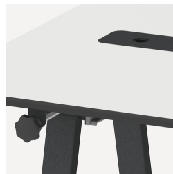
Multifunktional durch verschiedene Ausstattungsöglichkeiten