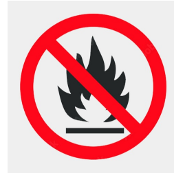
matériau du panneau support difficilement inflammable selon la norme DIN 4102 B1