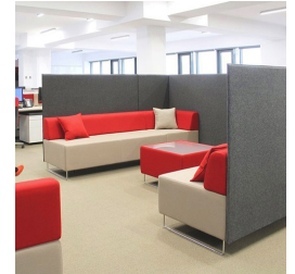
Extensible individuellement grâce à des éléments interconnectés