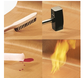
Coque indestructible en PAGHOLZ®, résistante aux rayures, aux chocs et aux flammes.