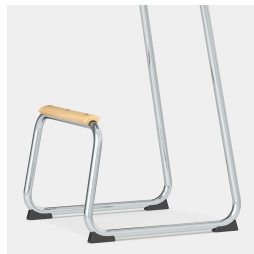
Cadre robuste pour les patins