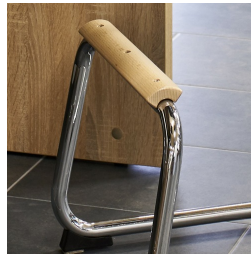
Repose-pieds laqué naturel