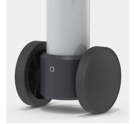
En option, châssis mobile grâce à 2 roulettes fixes