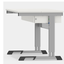
Grand espace pour les jambes en position fermée