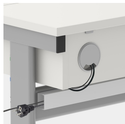
Gestion des câbles cachée grâce au canal d'énergie