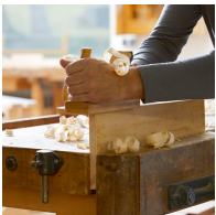
Bois de hêtre massif issu de la sylviculture durable avec vernis à base d'eau