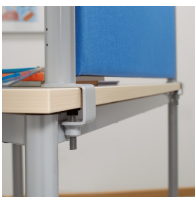
montage au moyen d'une vis à six pans creux sur le plateau de la table