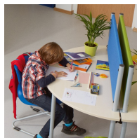
Idéal comme protection visuelle et acoustique