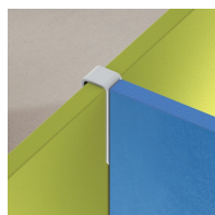
Assemblage de cloisons en T