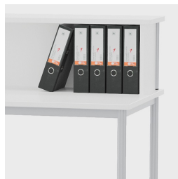
Suffisamment haut et profond pour accueillir des classeurs courants