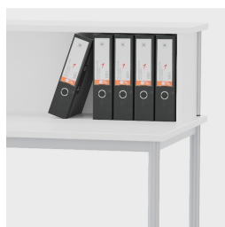
Suffisamment haut et profond pour accueillir des classeurs courants