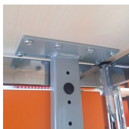
Vissé solidement au plateau de table

Vous trouverez notre gamme de matériaux et de couleurs dans l'aperçu des matériaux ASS.