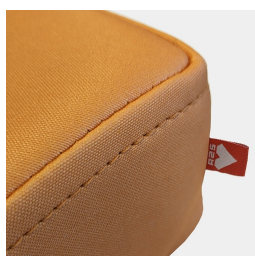
Couture rabattue de haute qualité