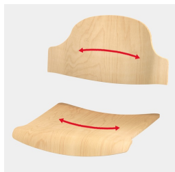
Assise et dossier moulés pour s'adapter au corps