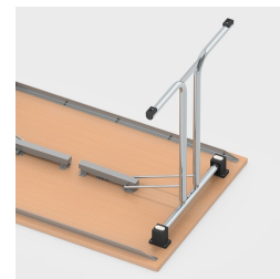
Pieds de table faciles à replier