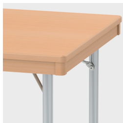
En option avec huisserie en bois massif en retrait