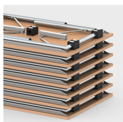
Jusqu'à 16 tables empilables