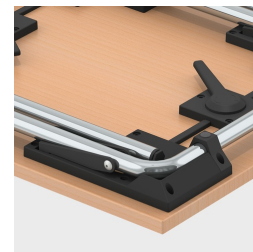
les protections d'empilage protègent le plateau de table des rayures