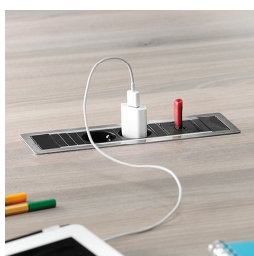
En option, deux prises de courant avec port USB ou connexion réseau : à gauche et à droite