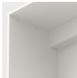
Avec passage de câbles intégré, à l'arrière