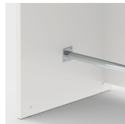
Repose-pieds inclus pour poser confortablement les pieds