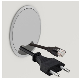
Passage de câbles latéral en option