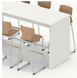
Possibilité de s'asseoir des deux côtés