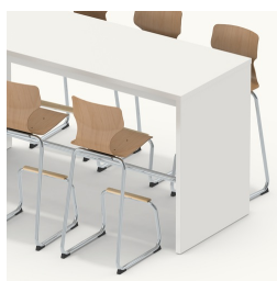
Possibilité de s'asseoir des deux côtés