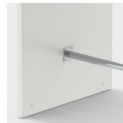
Repose-pieds inclus pour poser confortablement les pieds