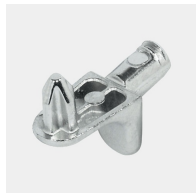
Supports d'étagères résistants à l'arrachement