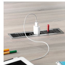
En option, deux prises de courant avec port USB ou connexion réseau : à gauche et à droite