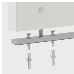
Fixation au sol en option