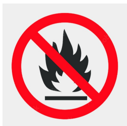
matériau du panneau support difficilement inflammable selon la norme DIN 4102 B1