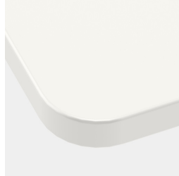
En option, plateau de table avec rayon d'angle de 40 mm