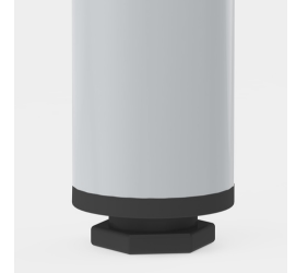
la protection de sol avec compensation de niveau compense les inégalités du sol