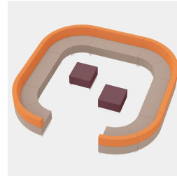
Extensible individuellement avec MAZE et les éléments d'assise droits DOMINO