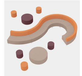
Peut être combiné avec les séries CYLINDA, BLOC ainsi que COMBI