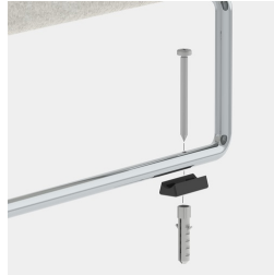
Optional mit geschraubter oder geklebter Bodenbefestigung