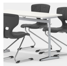
Sièges des deux côtés grâce au cadre de la colonne centrale