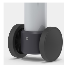
En option, châssis mobile grâce à 2 roulettes fixes