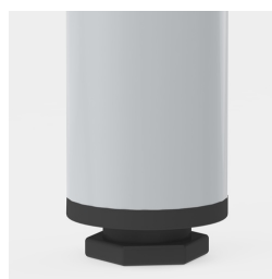
la protection de sol avec compensation de niveau compense les inégalités du sol