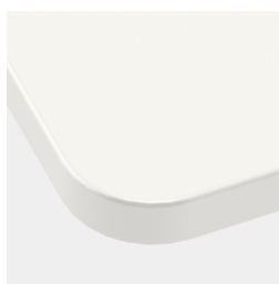
En option, plateau de table avec rayon d'angle de 40 mm