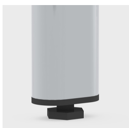
Protecteur de sol avec compensation de niveau pour égaliser facilement les irrégularités du sol