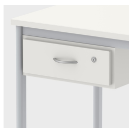
Comprend un tiroir pratique sous le plateau de table