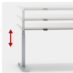
Réglage en continu et silencieux de la hauteur entre 62 et 127 cm