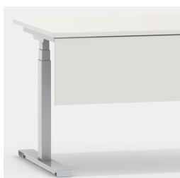
Accessoires adaptés : panneau frontal modèle 2050.202 et panneau latéral modèle 2050.162