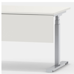
Accessoire adapté : panneau frontal modèle 2050.182