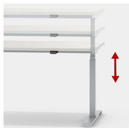
Réglage en continu et silencieux de la hauteur entre 62 et 127 cm