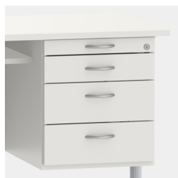
armoire basse avec tiroir à ustensiles et tiroirs à fermeture amortie et centralisée