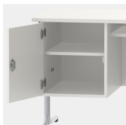
armoire basse, y compris une étagère, verrouillable au moyen d'une serrure de sécurité