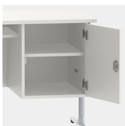
armoire basse, y compris une étagère, verrouillable au moyen d'une serrure de sécurité