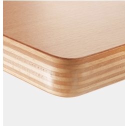
Option : plateau multiplex revêtu de mélamine