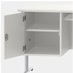
armoire basse, y compris une étagère, verrouillable au moyen d'une serrure de sécurité