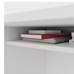
Incluant une étagère pratique