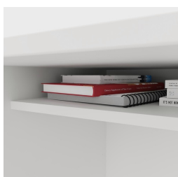
Incluant une étagère pratique