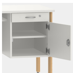
Unité de base incluant un tiroir, verrouillable au moyen d'une serrure de sécurité