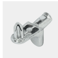
Supports d'étagères résistants à l'arrachement