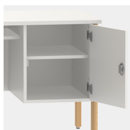
Unité de base comprenant une étagère, verrouillable au moyen d'une serrure de sécurité.