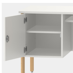
Unité de base comprenant une étagère, verrouillable au moyen d'une serrure de sécurité.