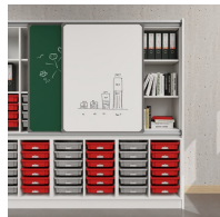
Tableau coulissant avec rails de guidage en aluminium et espace de rangement supplémentaire derrière les tableaux

matériau du plateau en mélaminé avec chants robustes en plastique