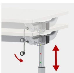
Hauteur réglable à l'aide d'une manivelle facile à utiliser.