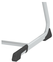
Protections de sol avec protection intégrée des marches