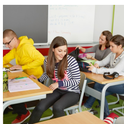
Il n'est pas nécessaire de déranger les pieds de la chaise pour s'asseoir ou se lever.