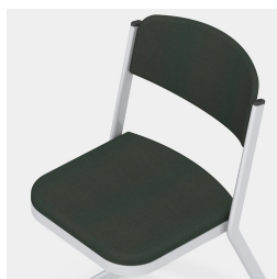
Avec coussin d'assise et de dossier