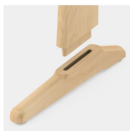
Construction durable et robuste : solidement mortaisée et collée.