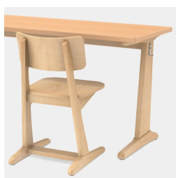
La forme en C permet de ne pas gêner les pieds de la table lors de la montée et de la descente de celle-ci.