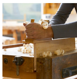
Bois de hêtre massif issu de la sylviculture durable avec vernis à base d'eau