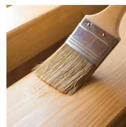
Vernis écologique à base d'eau.